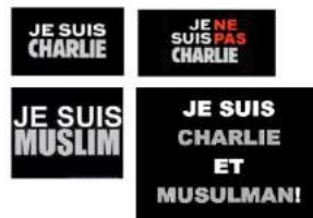
Bild 2: „Ich bin Charlie“ „Ich bin nicht Charlie“ „Ich bin Muslim“ „Ich bin Charlie und Muslim!“