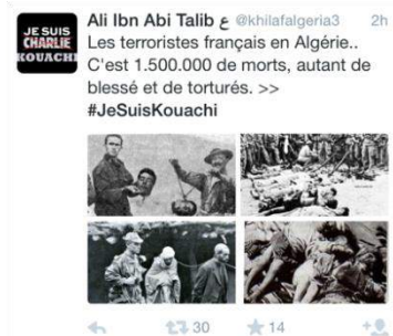
Bild 1: „Die französischen Terroristen in Algerien...1,5 Millionen Tote, ebenso viele verletzt und gefoltert. #IchBinKouachi“

In Auseinandersetzungen religiös extremistischer Akteure mit Fragen der internationalen Politik spielen die Geschichte antikolonialer Bewegungen von den 1920er und der Konflikt um Israel/Palästina genauso wie die Kriege in Syrien und im Irak eine prominente Rolle. Dabei wird neben religiösen Argumentationen ausdrücklich auch eine Kritik an Kolonialismus und Imperialismus formuliert, die sich gegen Muslime in aller Welt richteten. In dieser Argumentation stehen die Anschläge in Paris im Jahr 2015 für einen Akt der Verteidigung gegen eine vermeintliche Unterdrückung durch „den Westen“ (Bild 1). In diesem Zusammenhang wird vielfach auf Doppelstandards und eine „Doppelmoral“ westlicher Politik hingewiesen, die in der Unterstützung repressiver Regime zum Ausdruck komme. So würden politische und wirtschaftliche Interessen westlicher Staaten durch humanitäre Argumentationen verschleiert.