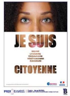
Bild 4: „Ich bin Brünette, Schülerin, Muslimin, Vegetarierin, Rockerin, Bürgerin.“