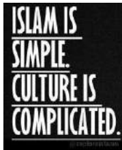
Bild 1: „Der Islam ist einfach (zu verstehen). Kultur ist kompliziert.“

Eine mögliche Antwort auf entsprechende Diskurse besteht in der Betonung der innerislamischen Vielfalt in Tradition und Geschichte, um Jugendlichen und jungen Erwachsenen unterschiedliche Zugänge und Deutungsmöglichkeiten zur Religion aufzuzeigen und eine Akzeptanz von Vieldeutigkeiten und Ambiguitäten zu fördern (Bild 3).